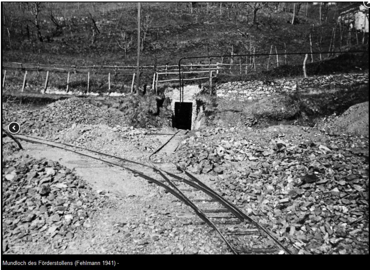
Mundloch des Förderstollens (Fehlmann 1941) -